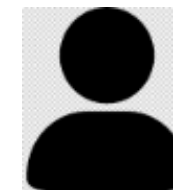
Manon ESTIVAL IDF