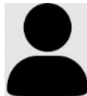
Amel MOUHIB Antilles- Guyane